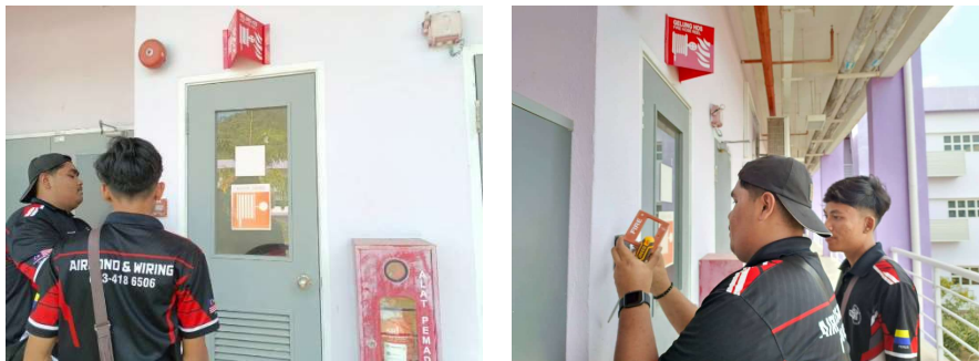
Aktiviti penyelenggaraan emergency button sistem pada 6 Jan 2025.