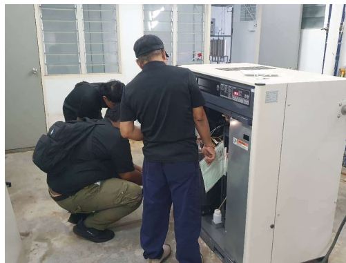
Proses penilaian sebutharga penyelenggaraan major untuk 2 unit air compressor di FKTM C pada 22 Jan 2025.