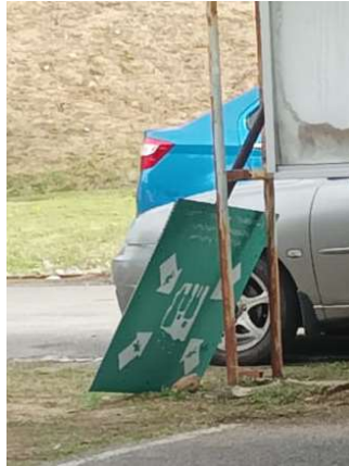
Papan tempat berkumpul zon C4 telah dilaporkan patah pada 23 Januari 2025.