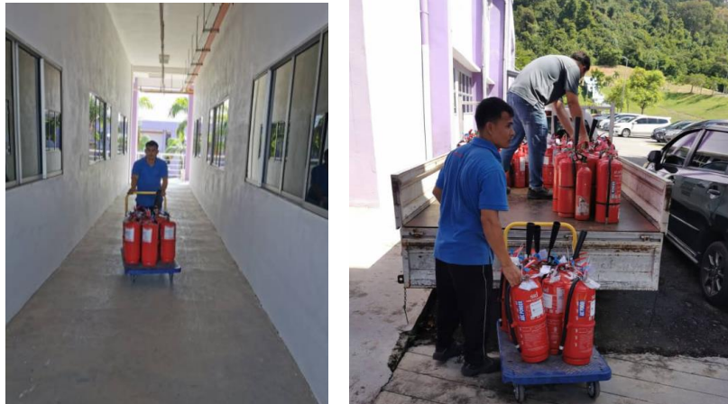
Pengumpulan alat pemadam api tanggungan Jabatan Pembangunan untuk proses pemeriksaan pada 6 November 2024.