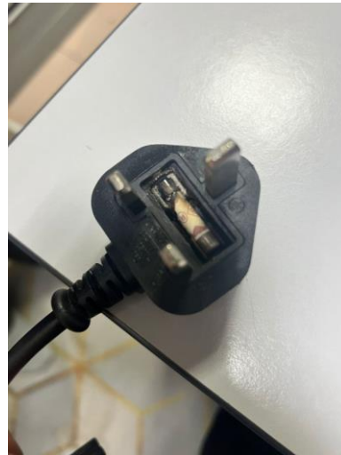
Kesan terbakar pada plug socket untuk portable air cond (yang sama pad 2 Okt) di Pejabat FKTM pada 7 Oktober.