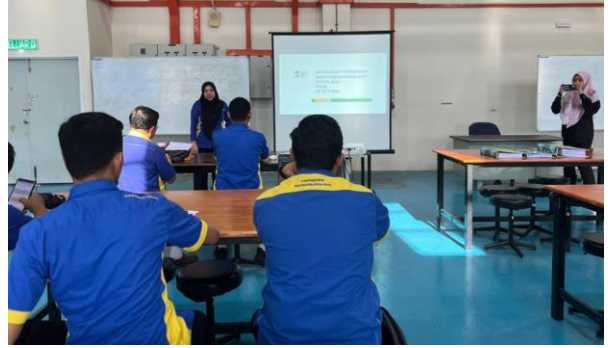
Lawatan audit KKP oleh COSHE di makmal FKTM B6 pada 15 Oktober 2024