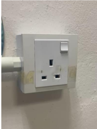
Kesan terbakar pada plug socket untuk portable air cond di Pejabat FKTM pada 2 Oktober.