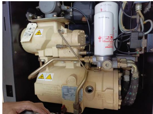
Major service kelengkapan alat pemampat udara pada 15 Oktober 2024