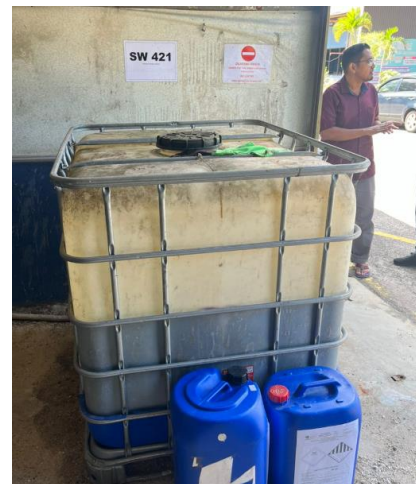
Penyerahan buangan terjadual ke stor pusat pada 22 Oktober 2024