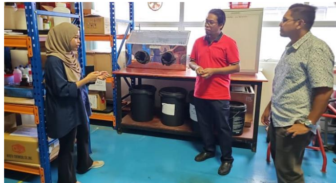
Lawatan COSHE ke makmal FKTM A19 atas pengurusan buangan terjadual pada 16 Oktober.