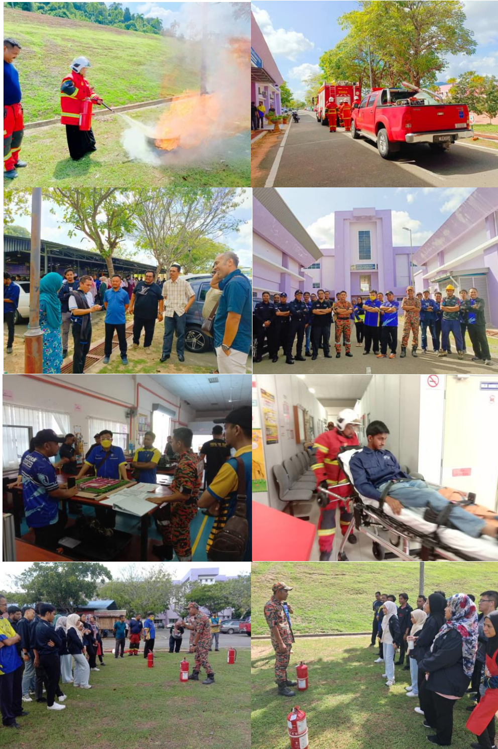
Latihan Pengungsian Bangunan (Fire drill)